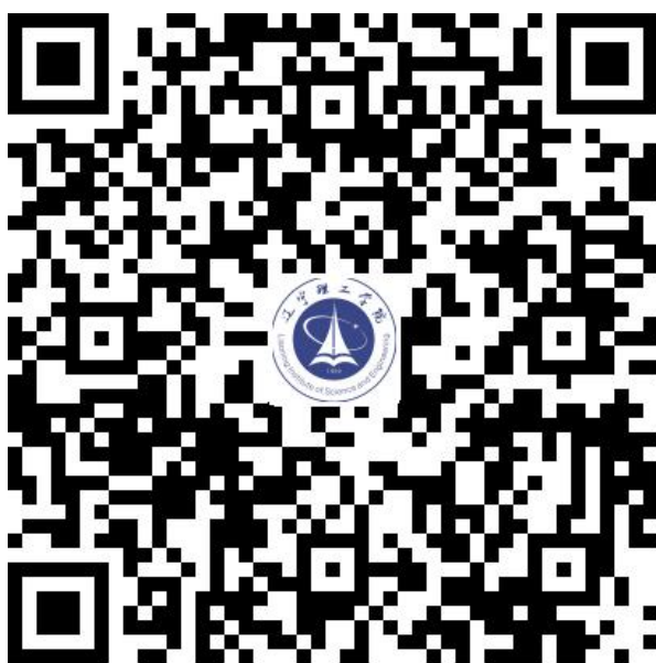
中国（锦州）2024 现代产业学院建设论坛会议费缴纳二维码