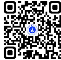
高校服务事项清单